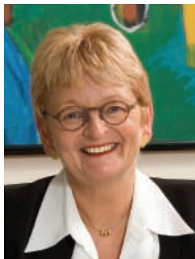
Marie-Josée JACOBS Ministre de la Famille et l'Intégration

Nos enfants sont notre présent et notre avenir!