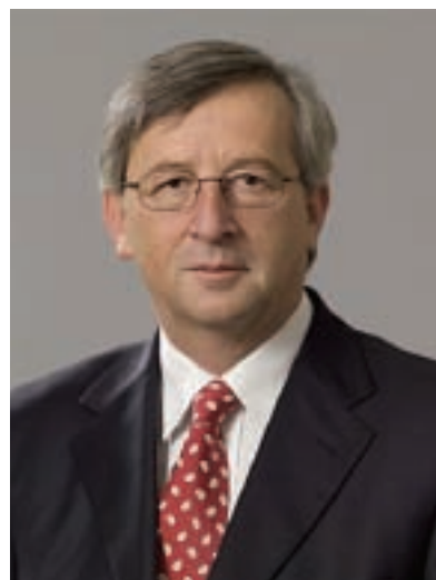
Jean-Claude JUNCKER Premier Ministre

Plutôt que d'opter pour une augmentation globale des allocations familiales pour chaque enfant, nous introduirons l'année prochaine des chèques-services destinés aux familles avec enfants. Le détail des services fournis en échange de ces chèques sera défini dans le courant des mois à venir. Cependant, une chose est sûre dès aujourd'hui: ces chèques-services permettront d'acheter un certain nombre d'heures dans les crèches, garderies et maisons-relais. La garde des enfants coûtera donc moins cher. À terme, il est clair pour moi que la garde des enfants doit être gratuite au Luxembourg. Le montant des chèques et la liste des prestations qu'ils permettent d'acheter seront fixés par la ministre de la Famille. (...) L'introduction progressive de la garde gratuite des enfants s'effectuera dans les limites des possibilités budgétaires de l'Etat. Le développement des possibilités de garde des enfants sera poursuivi. Le nombre de places de garde disponibles est passé de 8.000 en 2005 à 10.250 en 2006 et à 12.800 en 2007. Et cette évolution sera accélérée, parce que nous avons besoin de places supplémentaires.